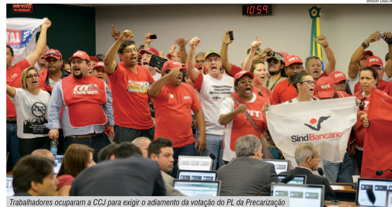
Trabalhadores ocuparam a CCJ para exigir o adiamento da votação do PL da Precarização

“O melhor caminho é a mesa de negociação, onde estão pessoas que vivenciam o tema e sabem o quanto esse projeto pode ser danoso para os trabalhadores e para a sociedade brasileira se for mal discutido”, afirmou.